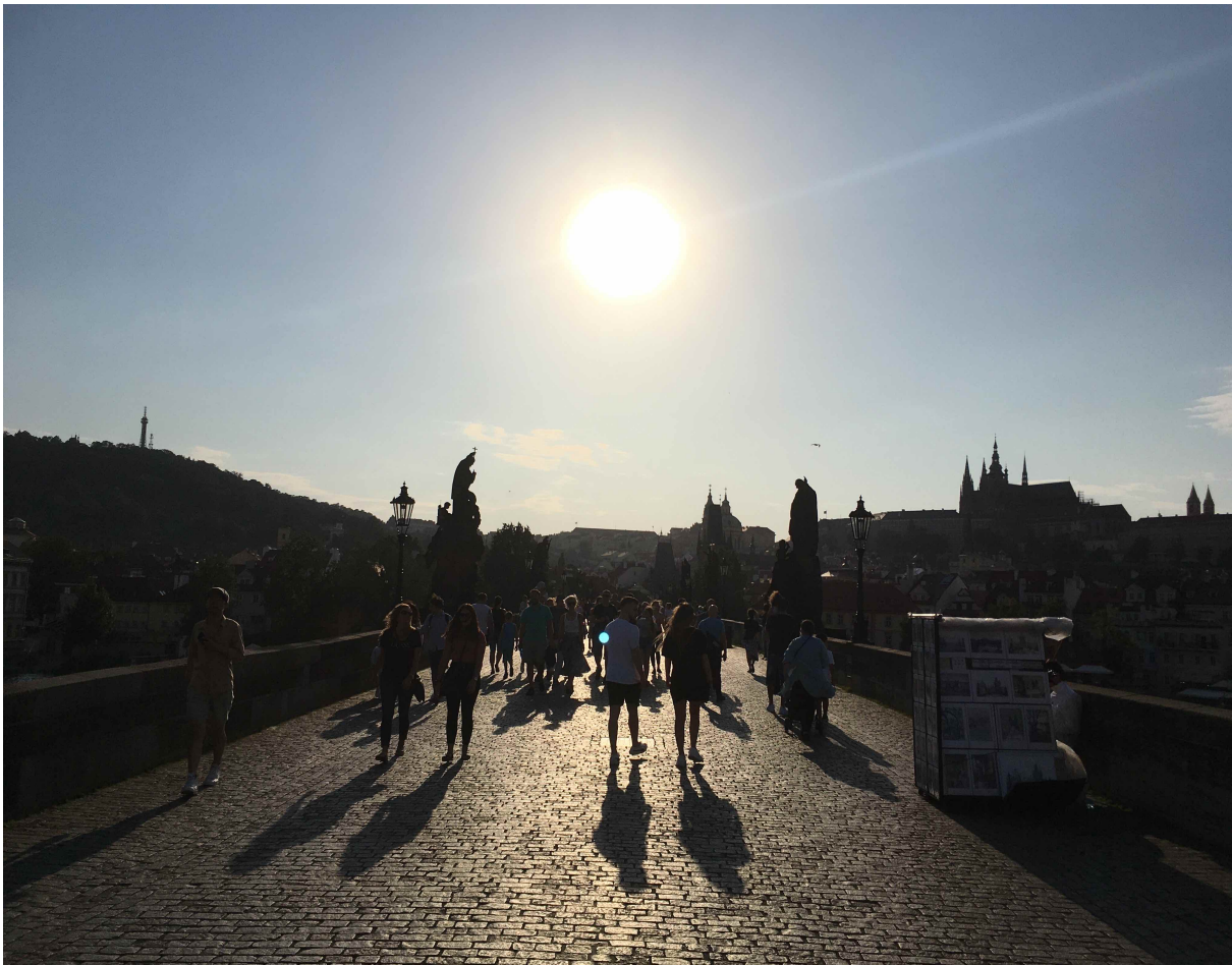
Praga. Most Karola

Z ankiet wynika jasno, że zdecydowana większość uczestników naszych spotkań woli jedno rekolekcje w roku (związane ze szkołą biblijną) i są to rekolekcje adwentowe. W tym roku zapraszamy do Ząbkowic Śląskich w dniach 13-15.12.2024. Rekolekcje czerwcowe natomiast będziemy chcieli odbyć zwiedzając chrześcijańskie zabytki Pragi. Przewidujemy je w dniach 13-15.06.2025. Wyjazd zorganizuje niezawodne biuro Wratislavia Travel. Wszelkie szczegóły (plan wyjazdu, koszty i sposób zapisów) będziemy podawać sukcesywnie na comiesięcznych spotkaniach w przyszłym roku.